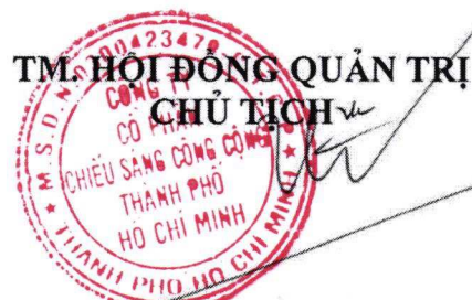
Trần Văn Hùng

Chỉ những hồ sơ đề cử/ ứng cử đáp ứng đủ điều kiện đề cử/ ứng cử và những ứng cử viên đáp ứng đủ điều kiện của thành viên Hội đồng quản trị hoặc thành viên Ban Kiểm soát mới được đưa vào danh sách trình Đại hội đồng cổ đông lấy ý kiến biểu quyết thông của các cổ đông trước khi tiến hành bầu cử.